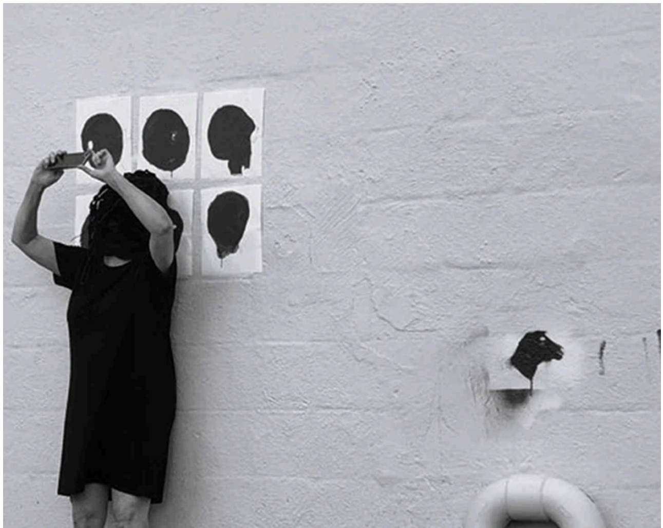
Performance Dévoiler ma vraie nature , Rimouski, août 2023

Une ligne de temps cette année ponctuée d'agréables moments de création à l'atelier – l'incubateur où grouille l'inconscient – à nourrir d'amour mes nombreux projets quotidiens ainsi qu'à l'atelier Argile pour réaliser un cumul de petits objets en argile blanche pour le projet Animale viscérale pas banale . Une année ponctuée aussi de quelques événements marquants.